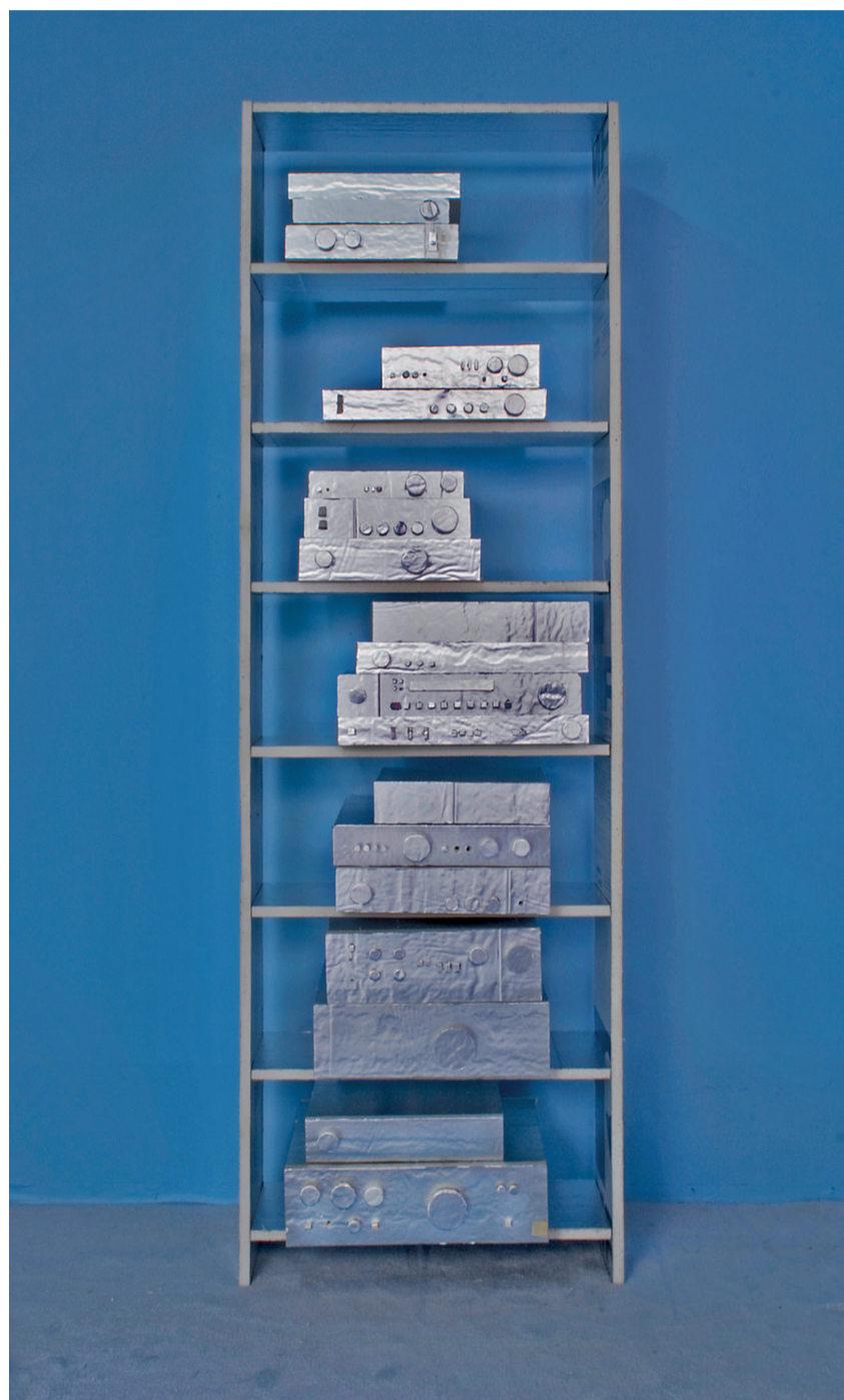
Rape of the Mirror: Stereos (detail), 2011, installation view, Night Gallery, Los Angeles, 2011.