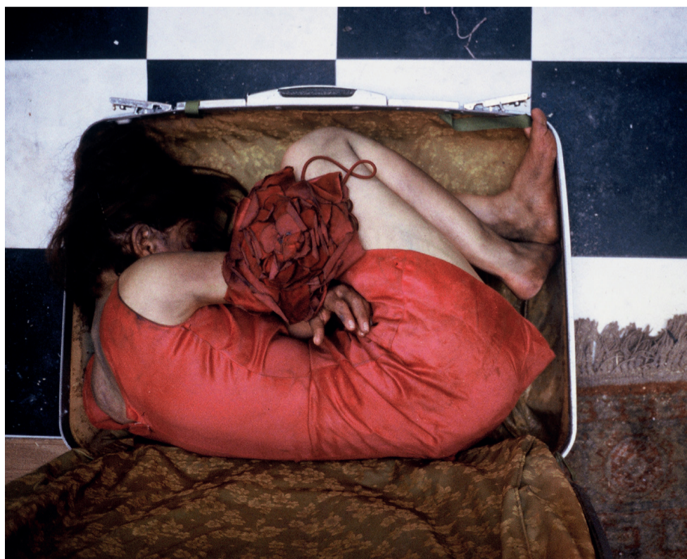
Top - Sugar , 2005 (collaboration between Reynold Reynolds, Patrick Jolley and Samara Golden).